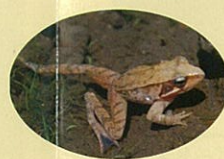
ニホンアカガエル