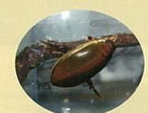
コガタノゲンゴロウ