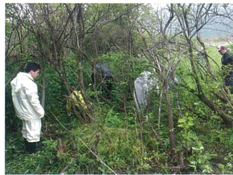
▲7/6(日)のボランティアワークキャンプにて。ノリウツギの林の中に生えているオオハンゴンソウを一株ずつ手ガマで刈っていきます。雨の降る中、地道で根のいる作業でした

駆除活動には、撲滅を目的とし、根ごと引き抜く「抜根」と種子形成を抑制する目的の「刈取り」などがあります。繁殖規模や緊急性などを考慮し、場所ごとに設定した目的に沿って駆除活動を行っています。