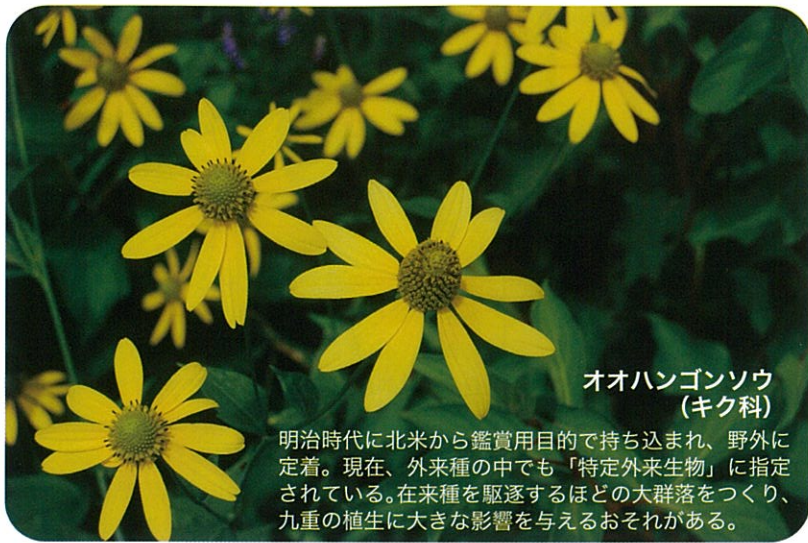
オオハンゴンソウ (キク科)

明治時代に北米から鑑賞用目的で持ち込まれ、野外に定着。現在、外来種の中でも「特定外来生物」に指定されている。在来種を駆逐するほどの大群落をつくり、九重の植生に大きな影響を与えるおそれがある。