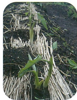
*ミニレポート* さとばるの畑

飯田高原の伝統野菜ひとつ「マタゴロ」。里芋の一種で、親芋まで食べられます。当校では伝統野菜の保護や継承活動にも取り組んでいます。